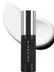
UNICEYES TRIPLE ACTION CONTOUR