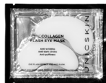
UNICCOLLAGEN FLASH EYE MASK

*Resultados basados en un estudio clínico con 23 personas que usaron luz LED roja durante 20 minutos al día, 3 veces a la semana, durante 3 semanas.