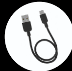
Cable de carga USB-C