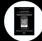
Manual de uso expres