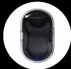
Estuche de carga inteligente