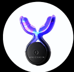
Dispositivo UNICLED WHITE SMILE 5.0

UNICLED WHITE SMILE 5.0 se presenta en un estuche compacto y elegante que incluye todo lo necesario para comenzar el tratamiento de forma cómoda, segura y eficiente.